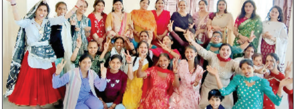
मेनी गलर्स बीएड कॉलेज में प्री होली मिलन समारोह