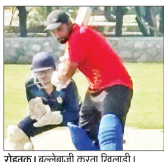
रोहताक। बल्लेबाजी करता खिलाड़ी।